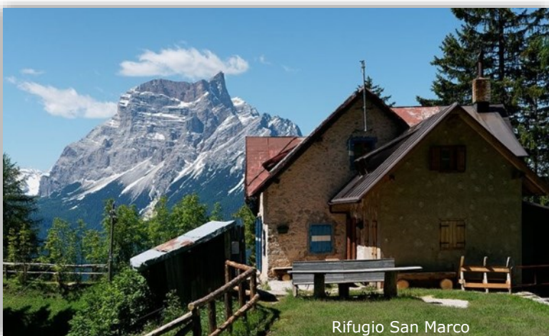
Rifugio San Marco

Il programma prevede: la partenza da Auronzo di Cadore, il primo pernottamento sarà al rifugio Monte Agudo, offre una bella vista anche sulle Tre Cime di Lavaredo. Secondo giorno pernosteremo presso il Rifugio Chiggiato, che durante i contatti ci ha detto: «sono sicura che le Marmarole vi resteranno nel cuore». Il giorno successivo saremo al rifugio Galassi, saremo sotto alle pendici del Monte Antelao oltre che alle Marmarole. La tappa successiva, può essere di riposo con percorso bre-