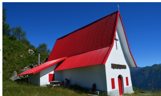
La chiesetta di San Calimero, ben visibile da tutta la valle per il suo inconfondibile tetto rosso.