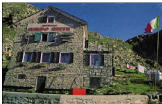
Nella foto: Rifugio Alfredo Rivetti

Dall'aspetto un po' tondeggianti, è una delle più importanti montagne Biellesi, seconda solo al Monte Mars, più alto e più famoso. Etimologia del nome: è una