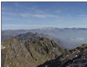
Nella foto: Pizzo dei Tre Signori

L'anno scorso, le funivie di Barzio per i Piani di Bobbio ci hanno dato il bidone, ma questa gita è troppo bella per rinunciarvi e perciò la