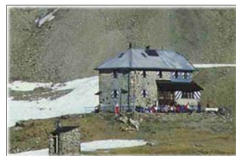
Nella foto: Rifugio Grassi

magnifico isolamento in cui si trova. Il rifugio Grassi è situato proprio ai suoi piedi, in uno degli ambienti più dolci ed ariosi delle Prealpi; utilizzando la funivia di Barzio per i Piani di