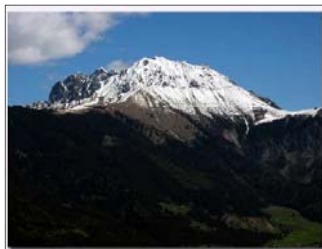
Nella foto: la Presolana

L'itinerario che noi effettueremo ci permetterà di visitare