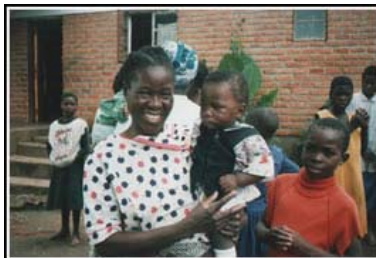
Nella foto: Popolazione del Malawi