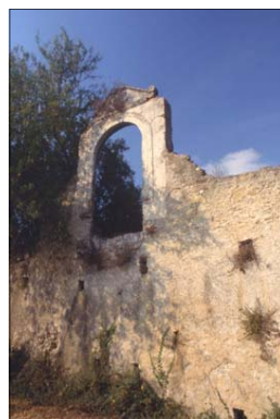
Nella foto: antichi edifici sulla via Julia Augusta

dall'isola di Gallinara, appena a un chilometro e 600 metri dalla terraferma con il suo profilo che ricorda una grande testuggine ricoperta da pini d'Aleppo, lecci e una fitta macchia arbustiva. Oltre alla panoramicità, l'escursione ha come motivi d'interesse l'incontro di reperti archeologici, dai tratti ben conservati della Via Julia Augusta,