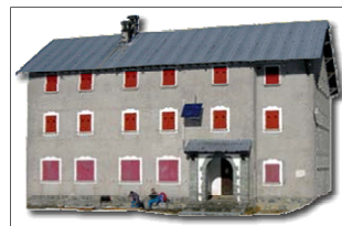
Nella foto: Rifugio Laghi Gemelli

La zona dei Laghi Gemelli è una delle più frequentate delle valli bergamasche, ma non per questo non merita una visita che, se fatta ad inizio