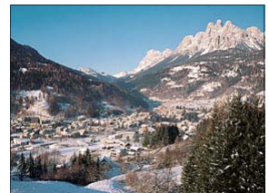
Fiera di Primiero

quasi interamente compresa nel parco naturale Paneveggio-Pale di san Martino, offre 15 Km di piste oltre i 2000 m. di altitudine grazie al precoce innevamento naturale.