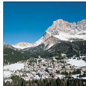
San Martino di Castrozza

“rossa” di 2 km con accesso dal centro di San Martino di Castrozza, consente lo sci notturno con illuminazione fornita da 40 sfere luminose. La ski area di Passo Rolle,