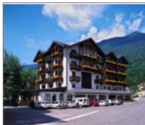
Hotel Isola Bella

Quest'anno, per la tradizionale cinque giorni in Dolomiti, saremo ospiti dell'Hotel Isolabella a Fiera di Primiero. Per gli amanti delle discipline invernali la possibilità di sciare nello splendido comprensorio di San Martino di Castrozza Passo Rolle. L'hotel, situato nella Valle del Primiero (750 m. s.l.m.), è circondato da una natura incontaminata in uno scenario Dolomitico di