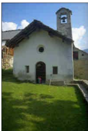
Nella foto: Chiesa Campertogno

Campertogno, un angolo stupendo della Valsesia. Su tutto l'arco alpino si trovano numerose manifestazioni della religiosità: chiese,