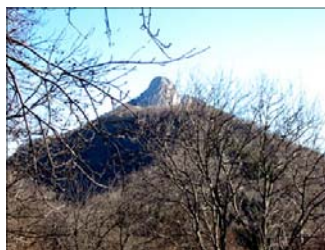
Nella foto: Cima di Canzo

La forma inconfondibile dei Corni di Canzo è conosciuta in tutta la Brianza ed oltre. Le tre pale di calcare che sventano dai boschi sottostanti, pur non raggiungendo altezze eccelse, sono considerate